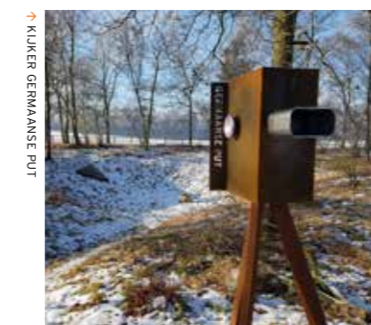
KLUKER GERMAANSE PUT

Actief stuivend zand komt buiten Nederland bijna niet meer voor in Noordwest Europa. Maar de kern van het Wekeromse Zand, een overwegend open gebied van ruim 100 ha, bestaat uit actief stuivend zand, diep uitgestoven laagten en begroeide 'forten'. Dit maakt het Wekeromse Zand aardkundig, ecologisch en cultuurhistorisch zeer waardevol en voor wandelaars een heerlijk gebied om te dwalen.