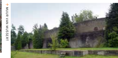
MUUR VAN MUSSERT