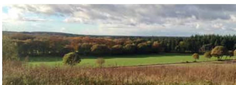
BELTVEDERE, UITZICHT OP DE GOUDSBERG