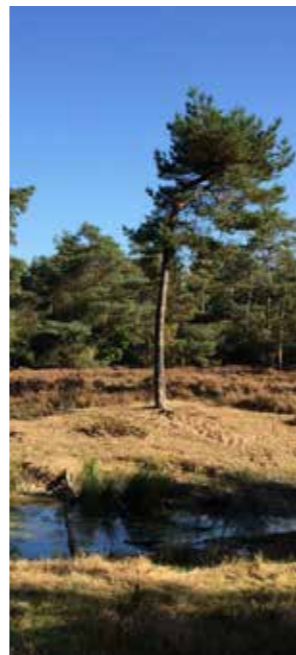
HET LUNTERSCHЕ BUURTBOSCH