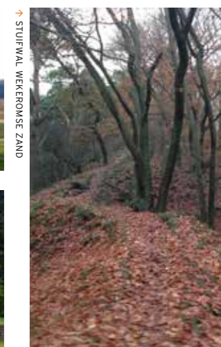
STUIFWAL WEKEROMSE ZAND