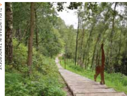
TIDLUNTRAP IN ZANDGROEVE